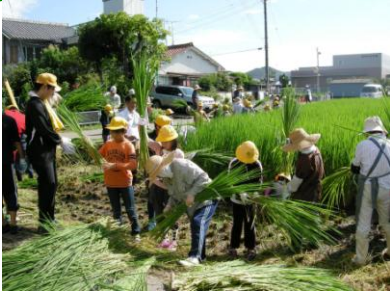
しめ縄づくり用の稲は、専用の田で作っています。