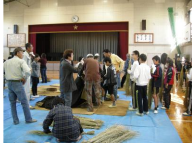
5年生と一緒に授業の一環として行いました。