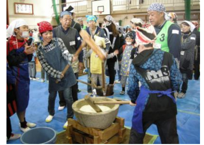
地域の方々が集まり、盛大に行われました。

長森北校区の有志が集まり、年間を通し長森北小学校5年生と一緒に“粃まき”“田植え”“青田刈り”“脱穀”“餅つき”といった“(もち)米作り”を行っています。作った米を用い、長森北小学校収穫祭にて餅つきが行われ、地域の方々が集まる大きなイベントとなっています。