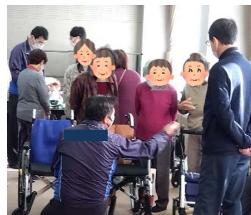
福祉用具の会社の方に ご協力いただきました。